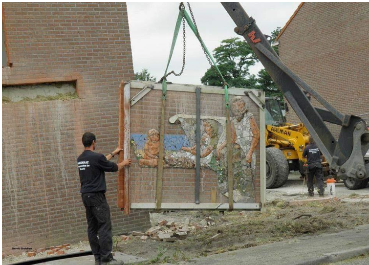
Foto: Gert Witteveen - Facebookgroep "Oud Hattem" – Personeel van de fa.. Lagemaat heeft het mozaïek vrijgemaakt uit de gevel

worden. De appartementen waren allang klaar en bewoond, de tijd vervloog. De gemeente Hattem was nog steeds in gesprek over terugplaatsing met Triada, het schoot niet op, waar