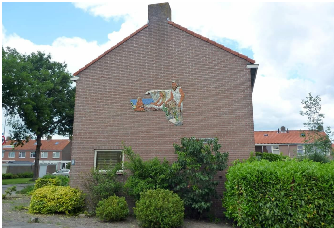
Oude situatie: Hoek Hollewand-Uilennest

Het mozaïek is door leden van het Beeldhouwersgilde Hattem en professionals van andere dimensies gerestaureerd. Velen van jullie hebben dit proces in het Atelier kunnen volgen. Het mozaïek is nu bevestigd aan de kopgevel op de hoek Zevenhuizen/Hollewand. Bewoners van het Uilennest en voorbijgangers hebben er straks weer een prachtig zicht op.