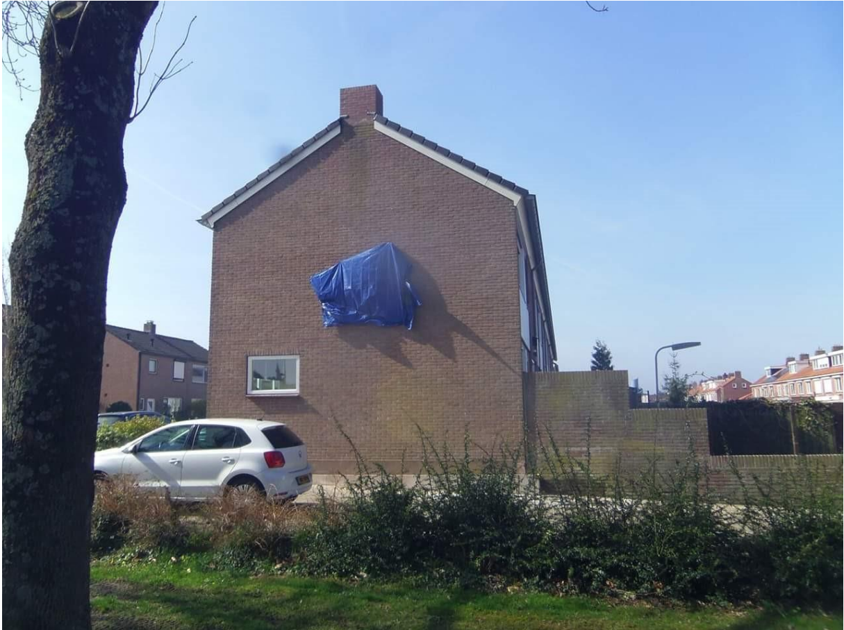
Mozaïek klaar voor onthulling op de nieuwe plaats hoek Zevenhuizen/Hollewand Foto: Gert Witteveen Facebookgroep "Oud Hattem"